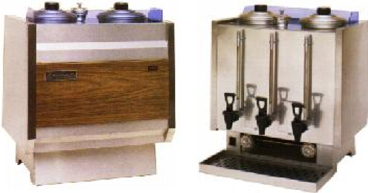
Modelo na foto - Máquina de café saco 2 depósitos c/vaso para leite